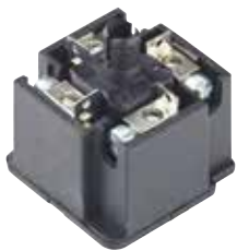
3+PE 系列 3+PE series